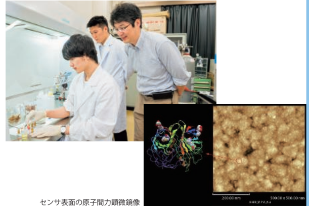
センサ表面の原子間力顕微鏡像

本研究室では、大きく性質が異なる無機系と生体系を融合したハイブリッドな素子構造を構築し、これらの機能を融合した新デバイスの開発を行っています。現在、微細加工技術を駆使したバイオセンサの開発を進めています。多様性保全のための研究に展開したいと考えています。