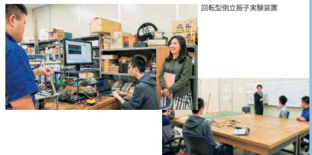
回転型倒立振り実験装置

この技術を探求しているのが「制御工学」です。我々とともに、より良い制御手法を研究しませんか？