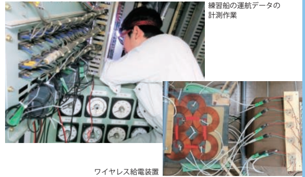
練習船の運航データの計測作業

本研究室では、本学の大型練習船を含む各種の船舶運航データの実測および解析を行うことで、より良い船内電機システムを検討しています。また、水中探査機向けのワイヤレス給電装置の開発にも取り組んでいます。