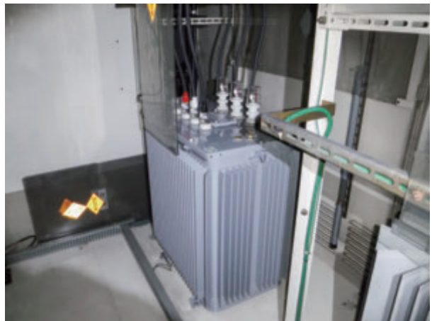
【工事後写真】 第一変電室 トッランナー基準変圧器