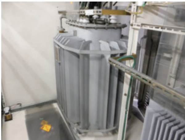
【工事前写真】 第一変電室 経年 30 年を経過した変圧器

■老朽化した変圧器の更新変圧器とは、本学においては東京電力より 6600V で受電した電気を各居室で使用する電圧である 100V もしくは 200V に降圧する機器のことをいいます。この変圧器は 24 時間電気を変成させており、無負荷損という電気の使用の有無に関わらない一定の損失が発生しています。この無負荷損は東京海洋大学に多く設置されている 30 年近く経過した変圧器と最新の変圧器では約 3 倍近くの差があります。また東京海洋大学で設置されている変圧器は設置から 30 年近く経過したものが多く、意図しない故障等で大学全体が停電する危険が大きいものでした。そのため、平成 30 年より実施している基幹・環境整備により各電気室に設置されている変圧器を段階的に現行のトッランナー基準の変圧器への更新を実施しています。（トッランナー基準とはある基準の日を設定し、その時点で最も省エネルギー性能が高い機器を基準とし、今後発売する機器は基準となる機器以上の性能を持った機器でないと販売できないという国が定める制度となります。）令和 2 年度までに品川キャンパスにおける変圧器の更新が完了し、令和 3 年度の越中島キャンパスの第 5 実験棟電気室の変圧器の更新をもって事業が完了しました。本事業によって年間のエネルギー削減量は二酸化炭素換算で 40t（トン）程度の低減が見込まれています。（大学事業全体排出量の約 1%程度）