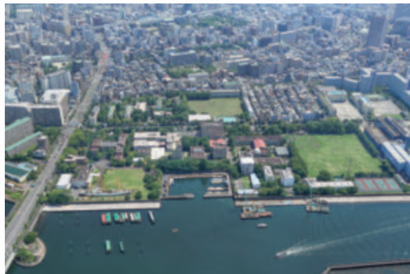
越中島キャンパス

東京海洋大学は、平成 15 年 10 月 1 日に東京商船大学と東京水産大学が統合して設立された新しい大学です。日本で唯一の海洋に関する総合大学として、海洋資源の確保、海上輸送の高度化、環境保全、海洋政策などに関する総合的な教育・研究の拠点として、優れた人材の育成と高いレベルの研究を推進すると共に、新たな海洋産業の振興育成に関わる学際的・先端的研究を行うために大学院の重点化を推進し、学部・大学院の連携した教育システムを構築することが重要な使命であり、国際的に活躍出来る高度専門職業人の育成を目標としています。