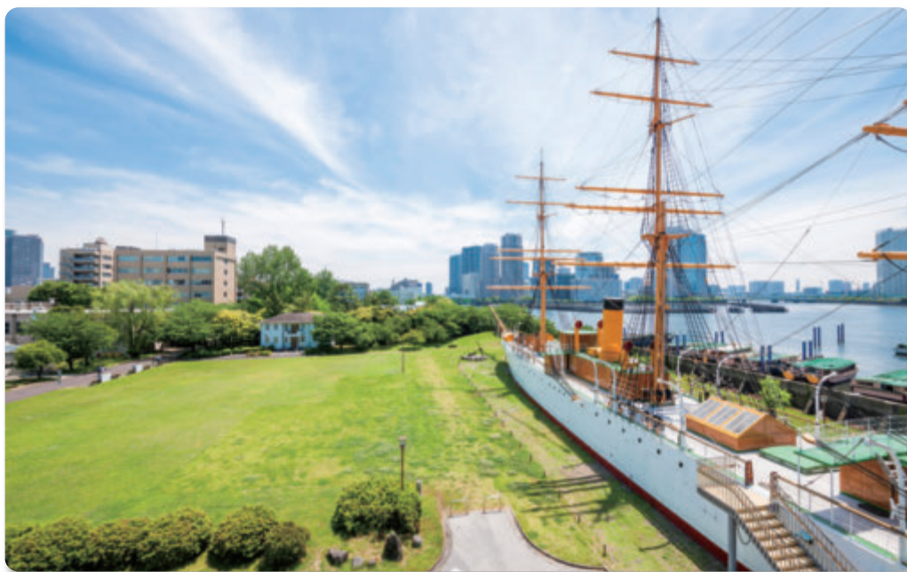
重要文化財 明治丸（越中島キャンパス）